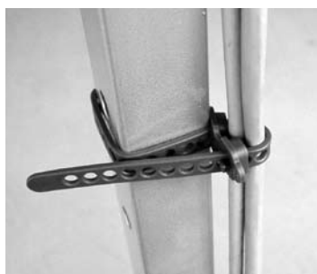
ダブルループ固定が可能 Can secure in double loops